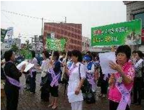
성매매 예방 캠페인