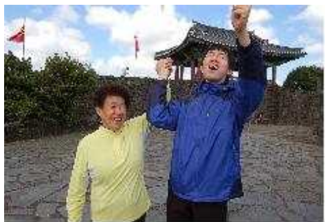
3차 올레길 체험