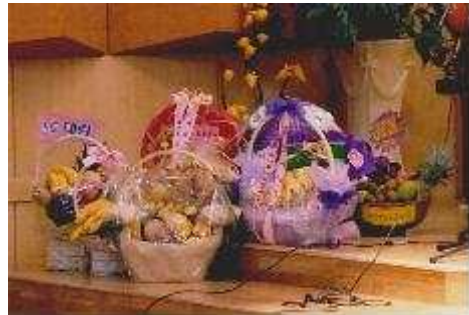
사랑의 과일 나누기