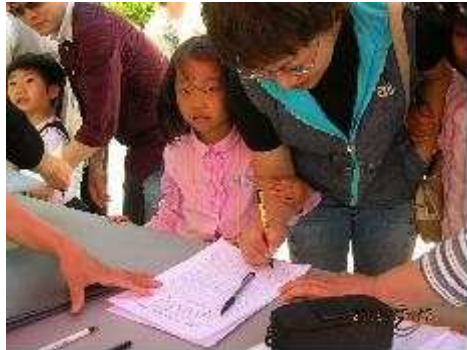
아동 지키미 캠페인