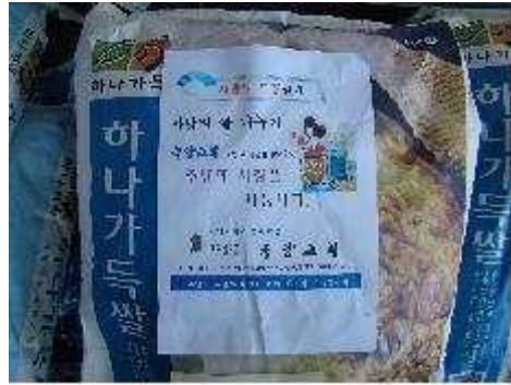
사랑의 쌀 나누기