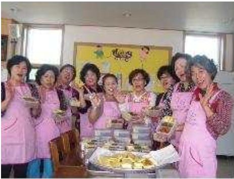
사랑의 밑반찬 나누기