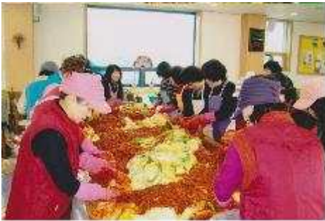
사랑이 김장 나누기