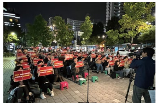
쿠팡 청문회를 촉구하는 거리기도회