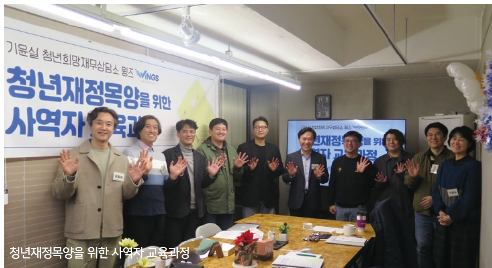
청년재정목양을 위한 사역자 교육과정

청년을 목양하는 사역자를 교육하는 <청년재정목양을 위한 사역자 교육과정>을 개설했습니다. 여러 선생님과 목사님, 전도사님을 만나 함께 고민을 나누고 어떻게 재정적으로 목양할 것인지 나누는 시간을 가졌습니다. 지역에서 기차를 타고 참여하실 정도로 교회와 공동체 안에 재정 문제로 고민하는 청년을 위해 무엇을 할 수 있을지 열정으로 고민하고 배우는 시간이었습니다.