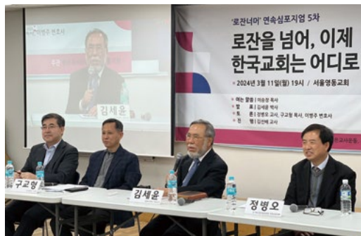
'로잔너머' 연속심포지엄 5차