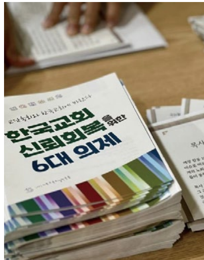
(위) 한국교회 교역자 표준동역합의서 공청회(5/30)