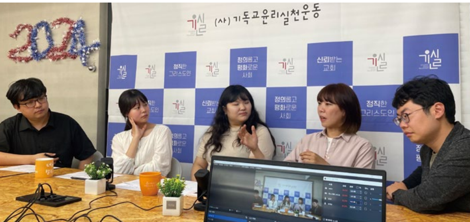
기독청년프로젝트 영상 촬영