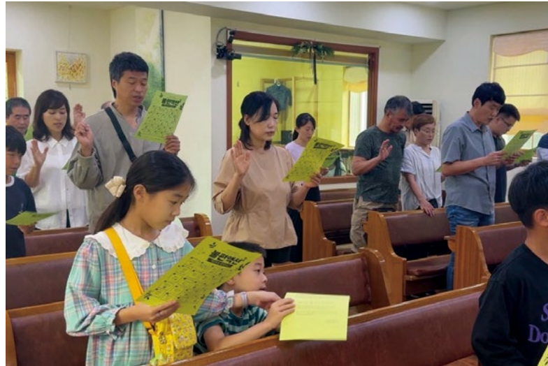
아라복음교회에서 불편액션 빙고판을 활동하는 모습

가을캠페인은 2023년에 이은 두 번째 불편액션이었는데, 총 15개의 공동체에서 참여신청을 했고 공동체에서 실천한 후에는 후기도 보내주셔서 함께 나눌 수 있었습니다. 후기와 함께 보내주신 사진에는 실천사항이 적힌 빙고판을 들고 함께 이야기를 나누는 장면이 실려있었는데, 기획하고 준비한 내용이 잘 사용되는 모습에 감사했습니다.